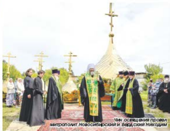
Чин освящения провел митрополит Новосибирский и Бердский Никодим

Хор пропел «Многая лета», знаменуя окончание праздни-