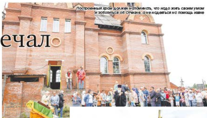
Построенный храм должен напоминать, что надо жить своим умом и заботиться об Отчизне, а не надеяться на помощь извне

11 лет шло строительство, за это время было собрано 11 млн руб., они уже освоены. Купола обошлись в 1,2 млн руб. Еще нет крыши, нет внутренней отделки. До окончания строи-